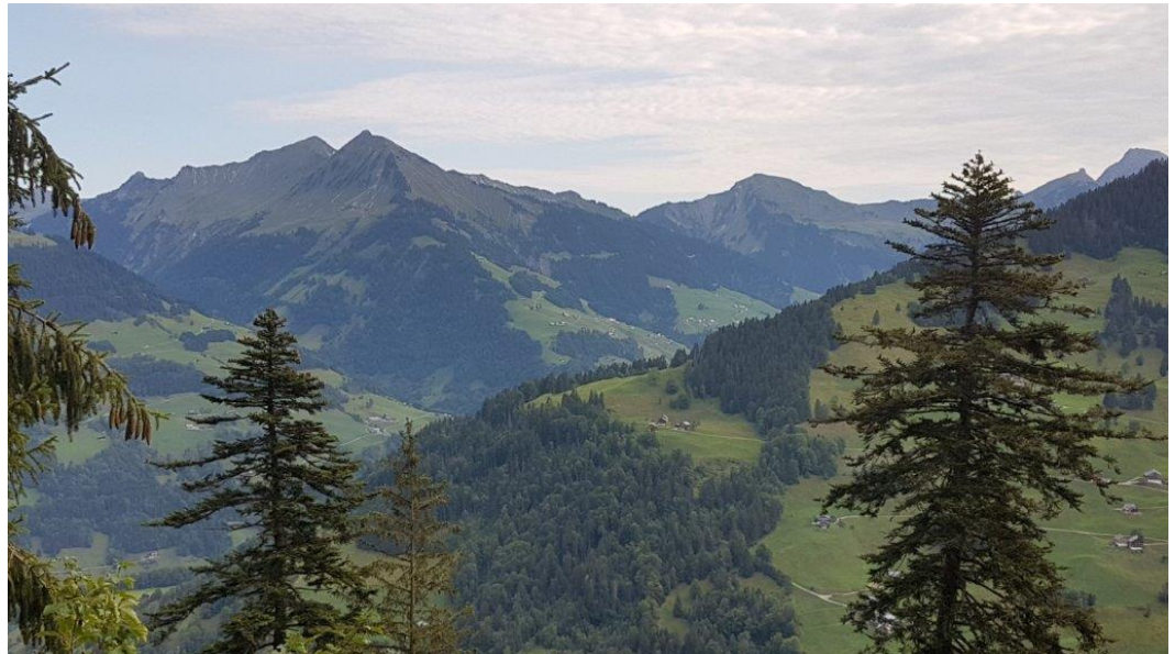
Glatthorn, Zafernhorn, vlnr

Mit etwa \frac{3}{4} Std. Verspätung marschieren wir los. Auf einem Fahrsträsschen gehen wir Richtung Frassenwald und erreichen bald die Abkürzung durch den Wald hinauf. Noch ein kurzes Stück Strasse, dann beginnt das schmale Weglein, blau/weiss markiert durch den sehr steilen Frassenwald zur Tiefensee-Alpe. Einige Stellen sind nass und schlüpfrig, ziemlich ausgesetzt und erfordern Konzentration.