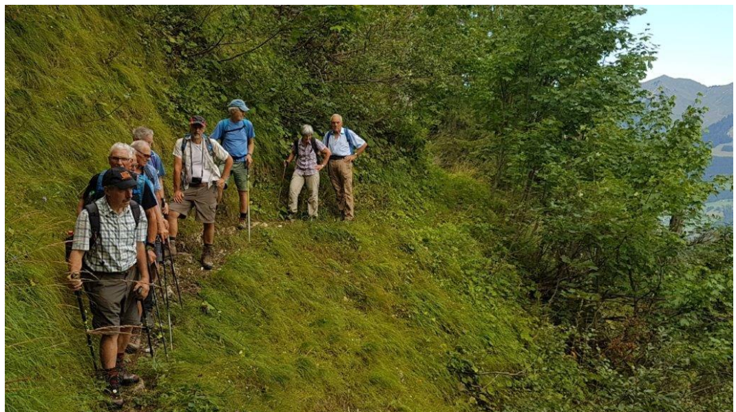
auf schmalem Weglein im Steilhang

Schöner Blick auf die andere Talseite. Nach etwa 1 \frac{1}{2} Std. erreichen wir die Tiefensee-alpe und machen eine längere Pause.