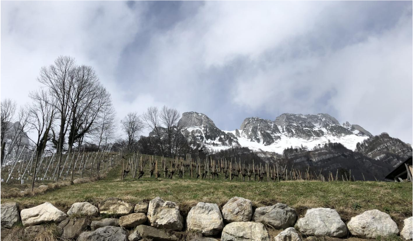
Oberhalb Sax auf dem Trübliweg; Ausblick zur Saxerlücke ganz links und Ambos