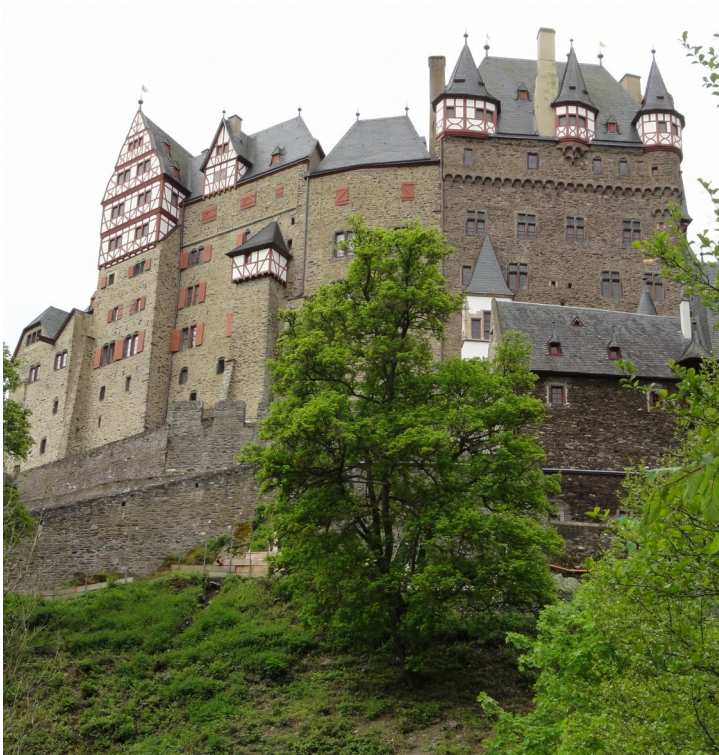
Die Burg Eltz

Am Donnerstag 8. Mai steht die berühmte Burg Eltz auf dem Programm. Frau Sabine bringt uns mit ihrem Bus nach Moselkern. Wir wandern ins Elztal hinein, das wir heute für uns allein haben. Nach vielen Windungen steht die Burg Eltz vor uns. Hier wimmelt es von Touristen. Doch ausser uns hat niemand Zeit, um sich in der warmen Wirtsstube mit dem Kachelofen bei Kaffee und Kuchen auszuruhen. Später steigen wir die Strasse hoch zu den Parkplätzen. Ein paar Schritte später sind wir wieder allein. Schweigend, nur mit Sehen und Hören, pilgern wir auf einem Jakobsweg bis zur nächsten Schutzhütte und halten dort Mittagsrast. Später, in Lasserger, gibt es nochmals Kaffee und Kuchen. Der Abstieg führt durch ein steiles Tobel an der Burg Bischofsberg vorbei an die Mosel.