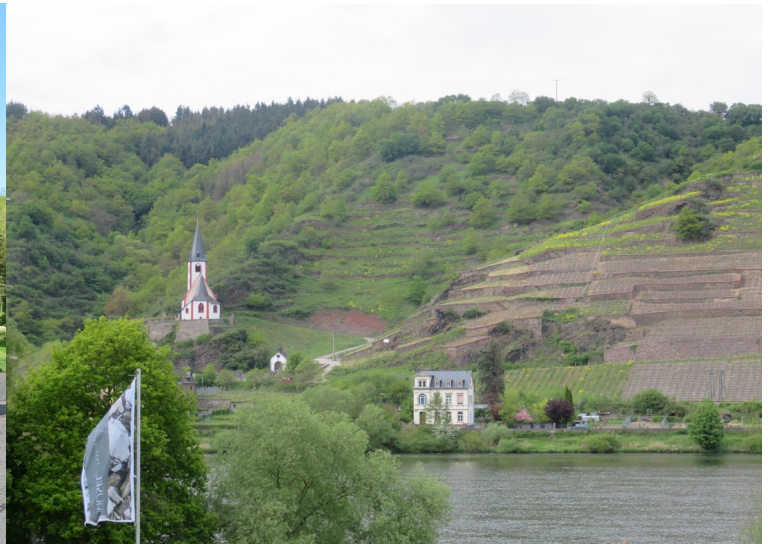
Blick aus dem Fenster

Hinter unserem Hotel «Peifer's» steigt das Gelände an, vorne ist etwas Park, dann kommen Strasse, Mosel, Strasse, Bahn und steile Rebberge. Die Fracht- und Kreuzfahrtschiffe fahren fast vor unseren Fenstern vorbei.