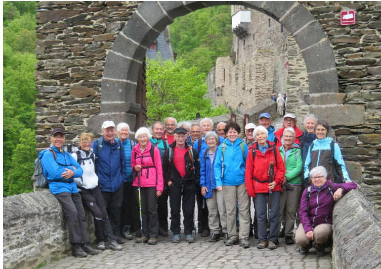
Unsere Gruppe vor der Burg Eltz

Vor Koblenz hat sich die Mosel 200 Meter tief in die Schieferfelsen der Eifel und des Hundsrück eingegraben. Dieses enge, gewundene Tal mit bewaldeten Steilhängen und Rebbergen und voller Burgen und Ruinen ist unser diesjähriges Wandergebiet.