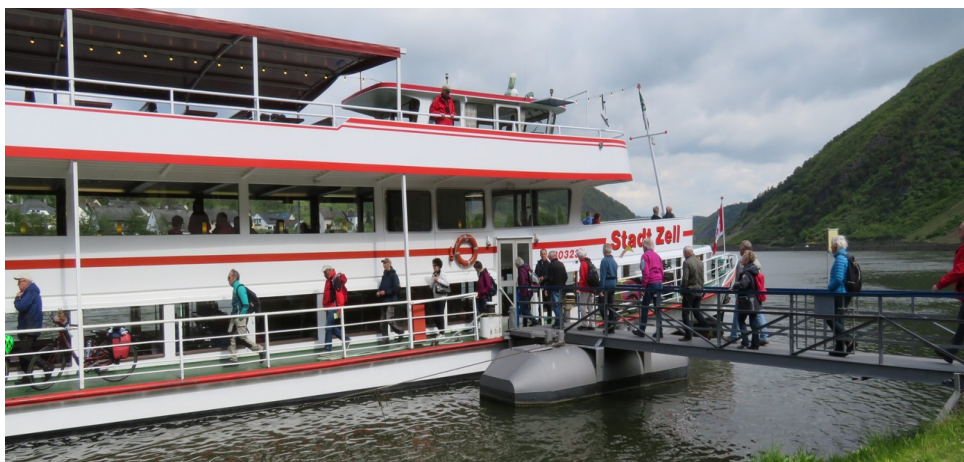
Auf nach Koblenz!

Am Freitag, 10. Mai ist individuelles Programm, was die meisten für einen Ausflug nach Koblenz benötigen.